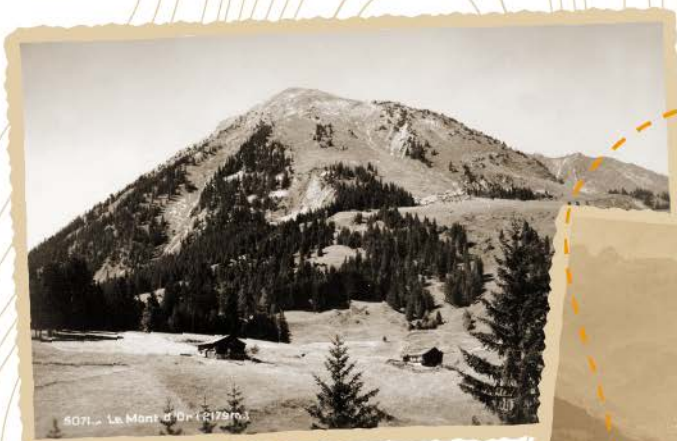
Le Mont d'Or